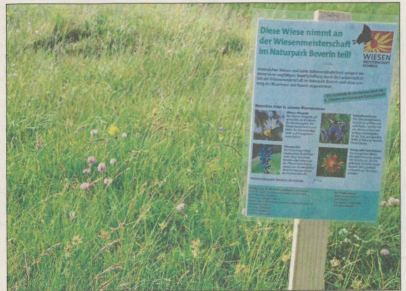
Cun talas tavlas en igls pros nudos ca sapartizpeschan da la concurenza.

Tanor nov criteris vignan igls pros ussa taxos. Sper la diversità da las sorts datan spezias raras – par exaimpel orchideas – puncts supplementars, lura igl tip da vegetaziùn, la qualità da pavel ad oters aspects. Igl tres pros da mintga categoria cugls ple blears puncts vignan premios igls 4 d'october a caschùn da la feasta digl Parc natural a Tschupegna.