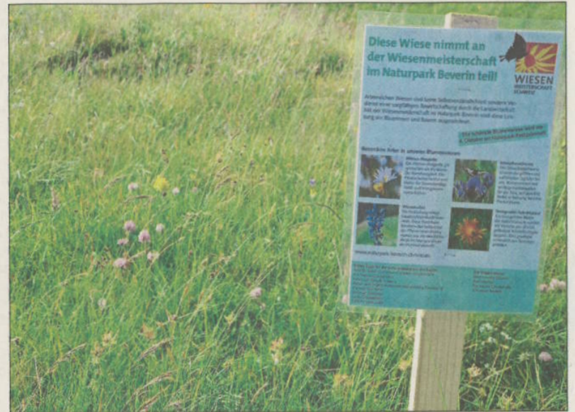
Cun talas tavlas en igls pros nudos ca sapartizpeschan da la concurenza.

Tanor nov criteris vignan igls pros ussa taxos. Sper la diversità da las sorts datan spezias raras – par exampel orchideas – puncts supplementars, lura igl tip da vegetaziùn, la qualitad da pavel ad oters aspects. Igl tres pros da mintga categoria cugls ple blears puncts vignan premios igls 4 d'october a caschùn da la feasta digl Parc natural a Tschupegna.